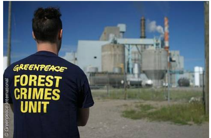
Aufgenommen am: 05.08.2004 Terrace Bay, CAN

In Kanada wird heute eine Urwaldfläche fast so groß wie Deutschland für die kommenden drei Jahre vor den Kettensägen der Holzindustrie geschützt. Von dem Einschlagstopp in den unberührten Lebensräumen profitieren unter anderem bedrohte Arten wie Bären, Wölfe und Karibus. Der Urwald Kanadas formt zusammen mit den Wäldern Skandinaviens, Russlands und Alaskas das größte Waldökosystem der Nordhalbkugel. Die führenden kanadischen Holz- und Papierhersteller haben sich aufgrund des Drucks von Greenpeace und großer Papierkunden wie Axel Springer Verlag, WAZ-Mediengruppe und DuMont heute in Toronto zu weiteren Verhandlungen über den Schutz der Urwälder und deren ökologisch nachhaltige Nutzung verpflichtet. Neben den 28 Millionen Hektar, für die jetzt der vorläufige Einschlagstopp beschlossen wurde, sind weitere 44 Millionen Hektar Teil der Verhandlungen zwischen Holzindustrie und Umweltschützern.