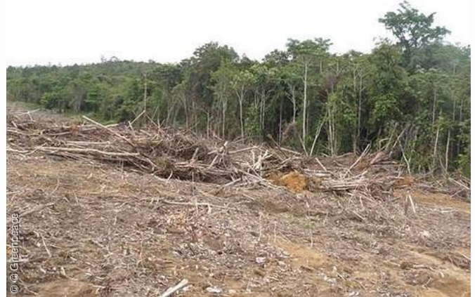
Land clearing location in PT. BAT (S 01° 52' 20.5" E 112° 32' 27.0") (21/03/10) Evidence picture caught Sinar Mas subsidiary PT BAT clearing rainforest bordering orangutan habitat in Central Kalimantan.

Die DEG begründet ihren Kredit damit, dass ihr Geld bei der Sinar Mas-Gruppe richtig angelegt sei; gerade die Größe des Konzerns gewährleiste, dass die gesamte Palmölindustrie zur nachhaltigen Produktion bewegt werde. Corinna Hoelzel, Waldexpertin bei Greenpeace, hält dies für verfehlt: "Die DEG greift mit diesem Kredit dem größten indonesischen Palmölkonzern unter die Arme, statt entsprechend ihres entwicklungspolitischen Auftrags kleine und mittelständische Unternehmen zu unterstützen oder das Geld für Waldschutz-Programme einzusetzen." Kritik kam auch aus den Reihen der Ausschussmitglieder: Warum unterstützt die DEG als Tochter der KfW-Bank einen börsennotierten Großkonzern, der industrielle Monokulturen in Indonesien finanziert?