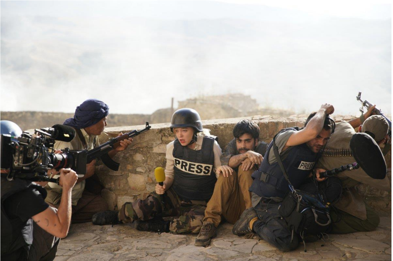
Mitte: France (Léa Seydoux) während einer Reportage

Juliane Köhler ist eine deutsche SchauspielerIn, die ihre Karriere zuerst im Theater begann. Anfang der 1990er Jahre begann sie mit ersten Rollen auch im Film Fuß zu fassen. Zwei Produktionen des Jahres 1999 sorgten für ihren endgültigen Durchbruch beim breiten Publikum, „Aimée und Jaguar“ sowie „Pünktchen und Anton“.