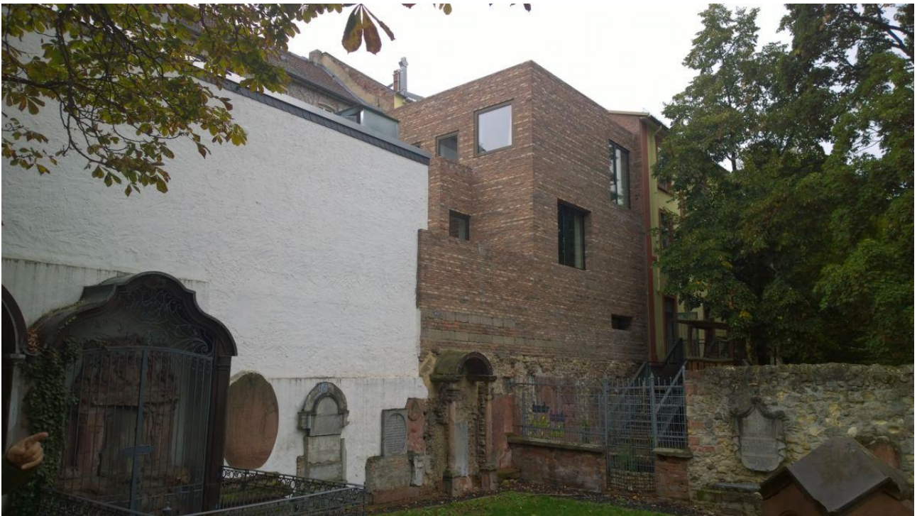
Stylepark Neubau am Peterskirchhof, Foto © Kulturexpress

Neben DiEM25 wurde der 7. Internet-Pavillon dank Lightbox, Galleria Valentina Bonomo, HYPERURANIUM.io und der Unterstützung von Gran (Media) Tour ermöglicht