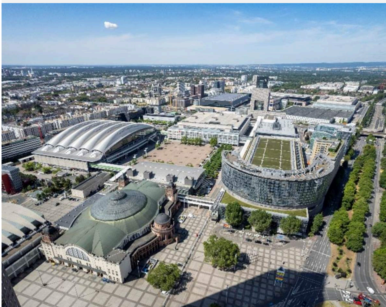
Messe Frankfurt – Überblick Gelände