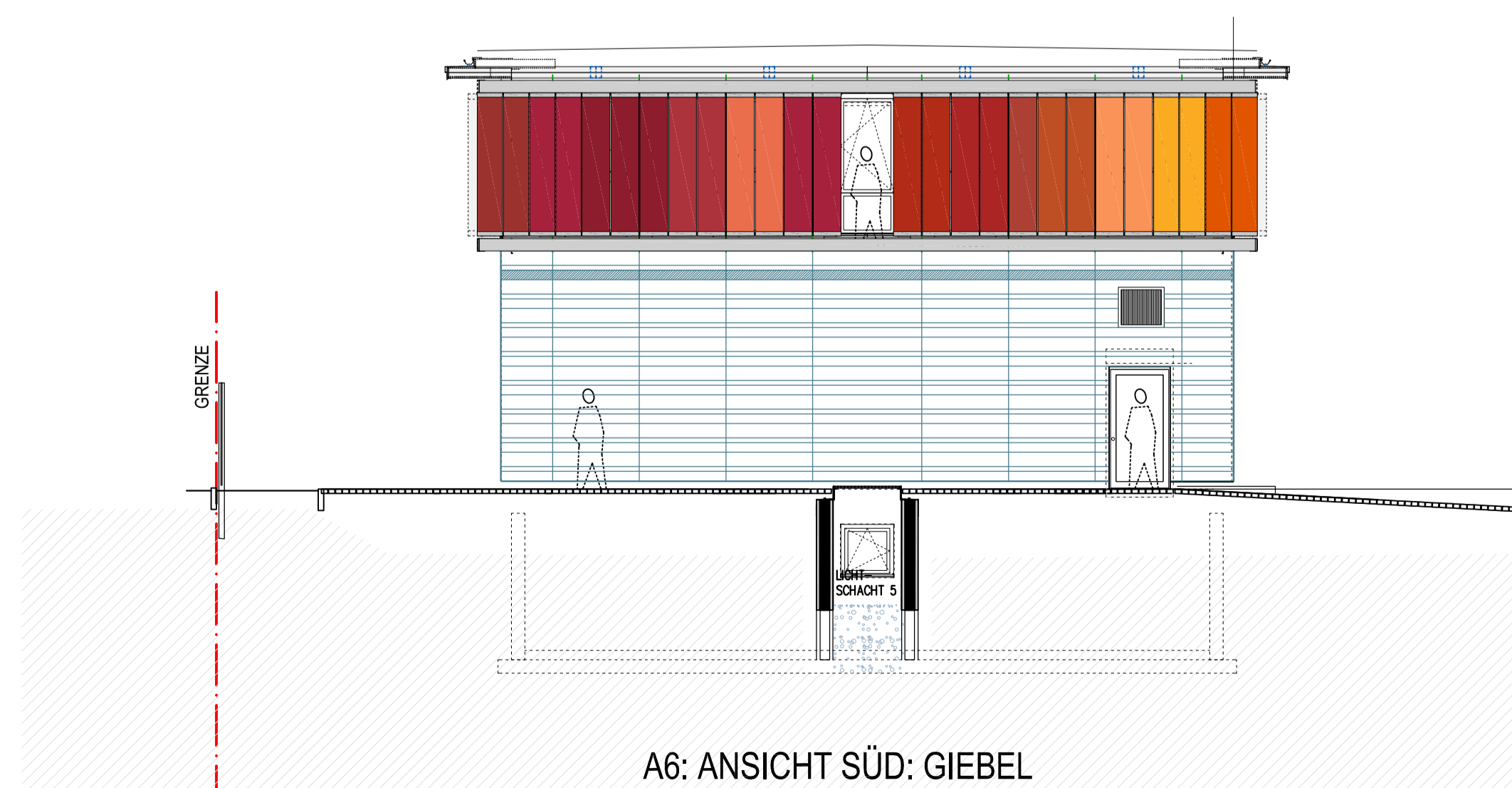
A6: ANSICHT SÜD: GIEBEL