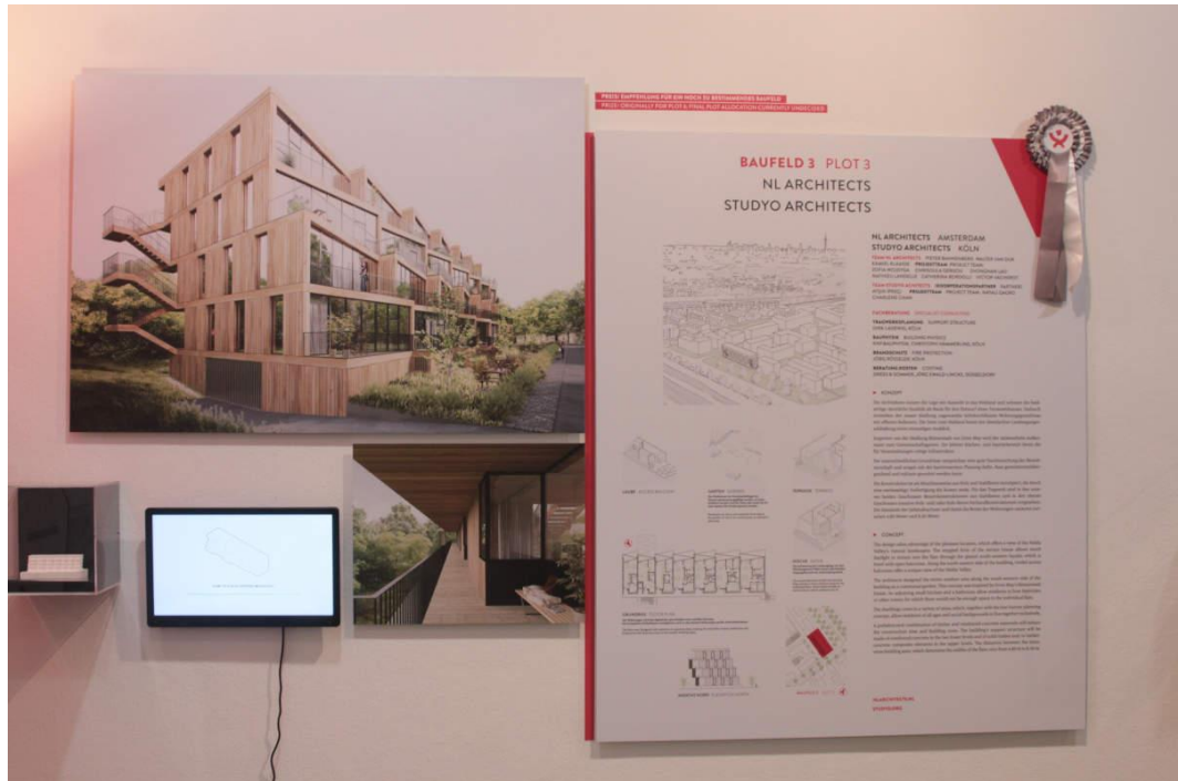
Preisträgerprojekt aus den Niederlanden

Holding und dem Deutschen Architekturmuseum, in Kooperation mit der Bundesstiftung Baukultur, dem Deutschen Städtetag sowie der Architekten- und Stadtplanerkammer Hessen.