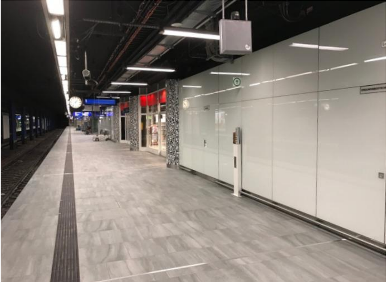
Rückbaufähige Neugestaltung des Flughafen Regionalbahnhofs Frankfurt am Main