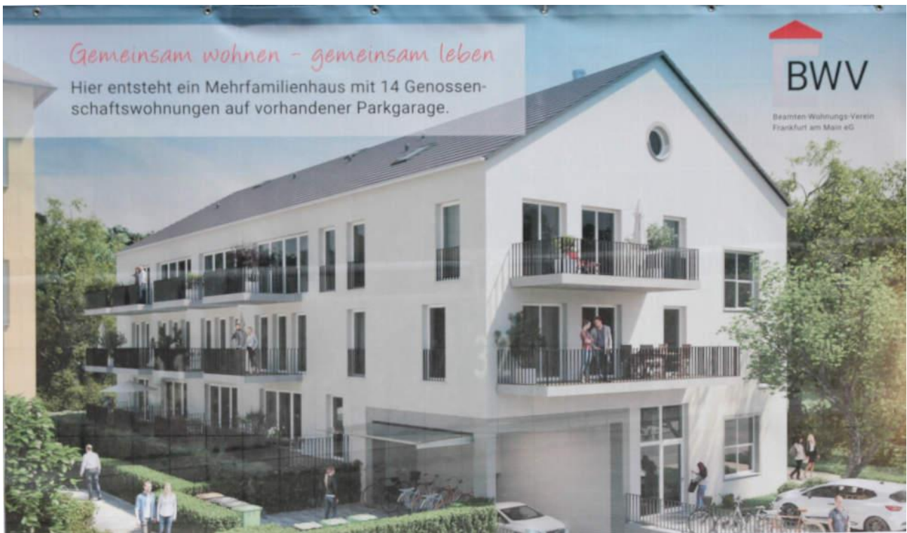
Neubau mit 14 Wohnungen in Kalbach bei Frankfurt

Parkdeck und abwärts in die Tiefgarage. Diese wurde in den Jahren von den Anliegern kaum genutzt und soll deshalb umgewandelt werden.