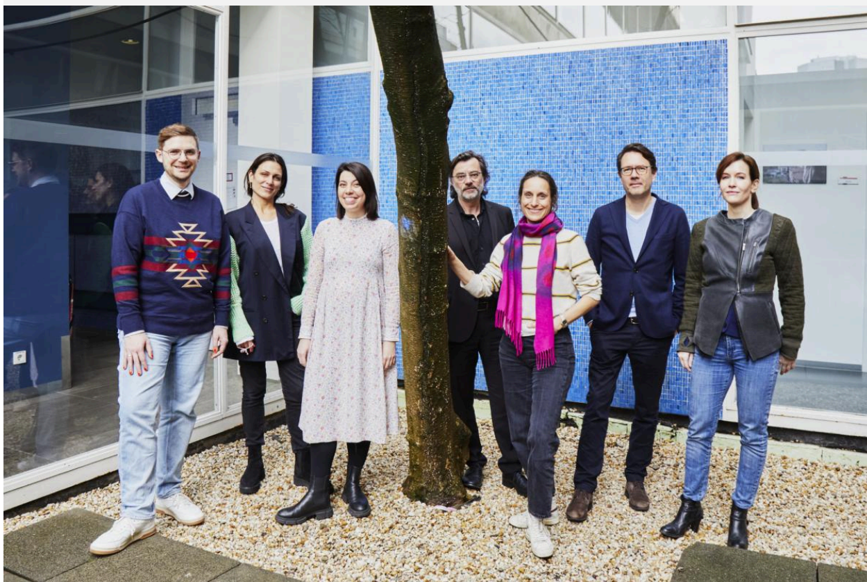
Jury Deutscher Buchpreis 2023