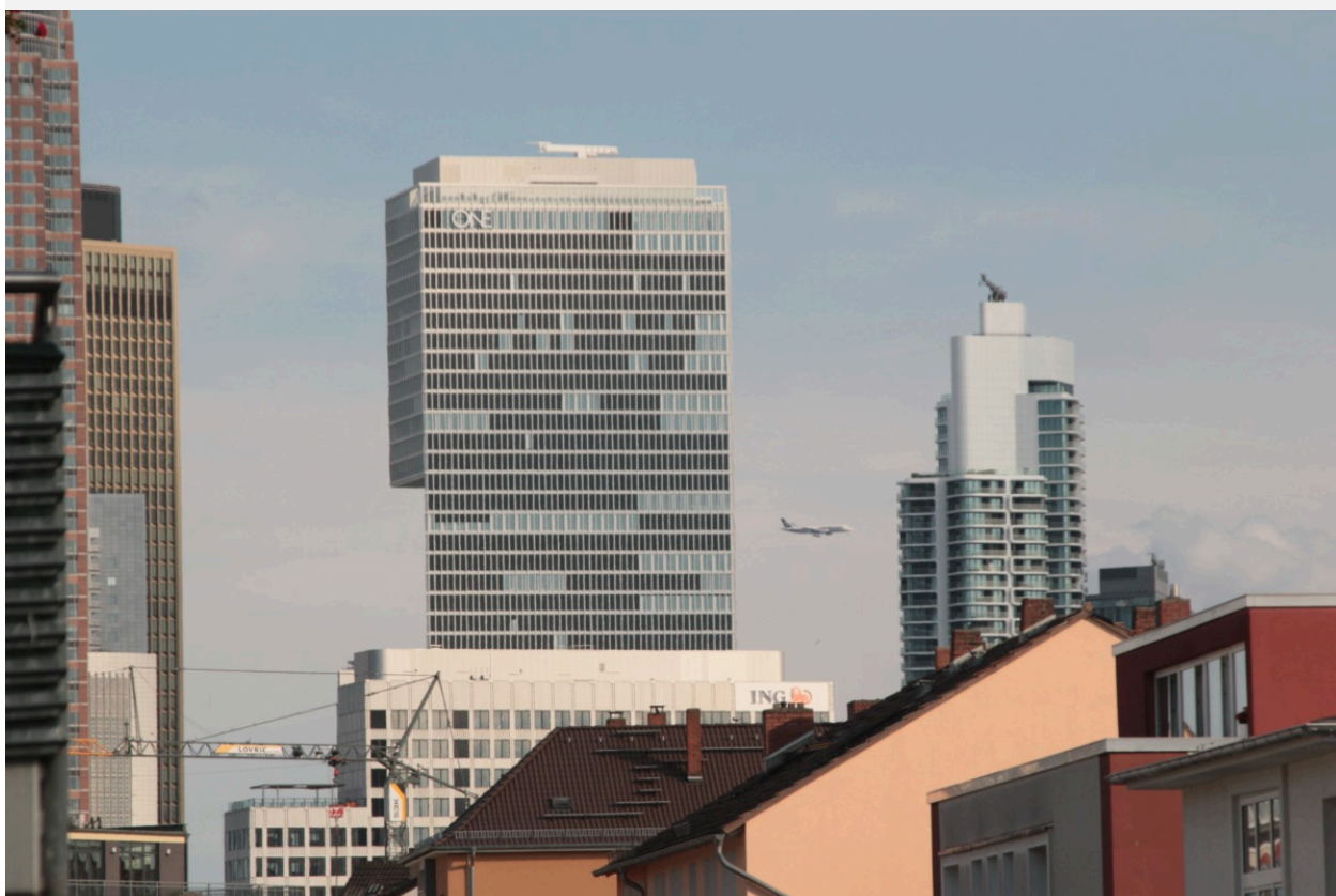
Tower ONE, August 2023