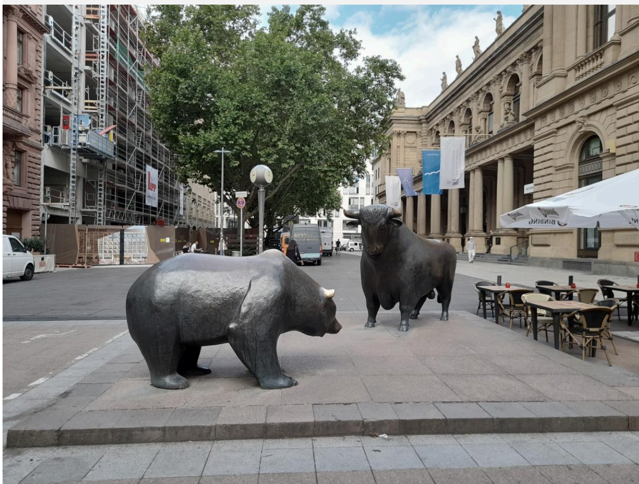
Bär und Bulle an der Börse